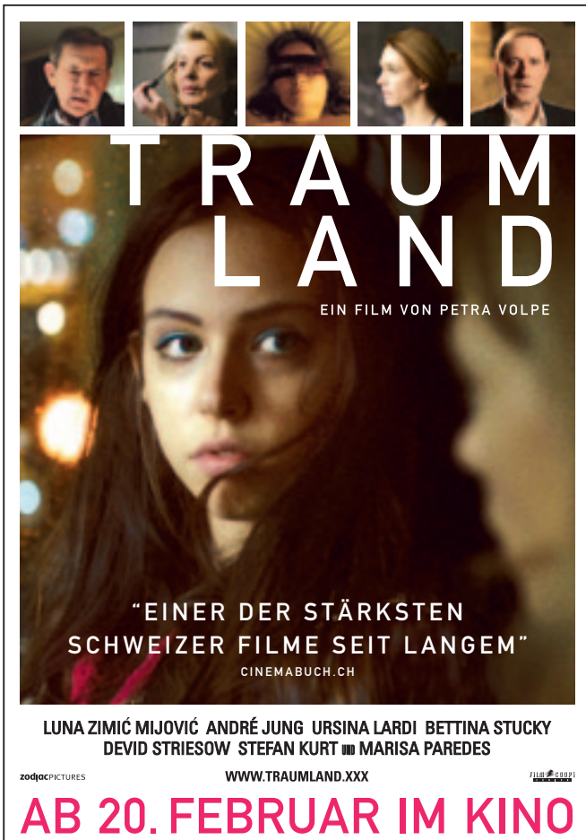
Steinenstrasse Luzern, Ende Dezember 2013.